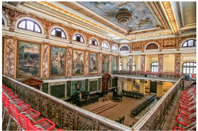
Aula Magna, Universiteit van Havana, waar het laatste SODAMC concert plaatsvond